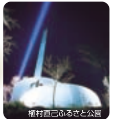
植村直己ふるさと公園